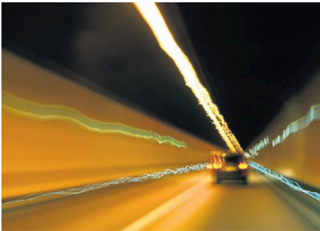
Abschnittskontrollen machen es möglich: Wer im Tunnel - oder auch sonstwo - zu schnell fährt, wird gebüsst.

Doch die Gesetzeshüter haben die Nase in diesem Räuber-und-Poli-Spiel gegenüber den Tempobolzern vorn; und und zwar nicht erst, seit sie ihre Radargeräte wie in Schwyz in einem Grüngutcontainer oder wie in Obwalden in einem Abbruchhaus versteckten. Die neueste Generation von Überwachungsgeräten ist unüberwindbar: Im Boden eingelassene Induktionsschwellen und