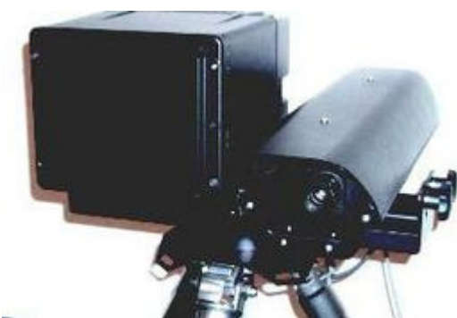
Fotografiert die Autonummern: Der AKLS der Ustermer Firma Multanova.