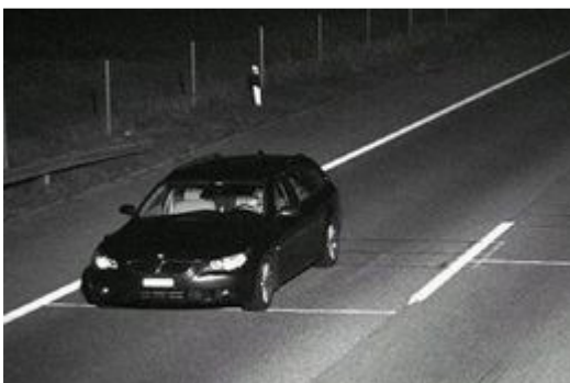
Rasern gehts an den Kragen: Kontrolle auf der Autobahn im Kanton Solothurn.

Versetzte Fotokameras übermitteln Bilder an einen Computer, der die Durchschnittsgeschwindigkeit ermittelt. Die Polizei muss nur noch eine Busse verschicken.